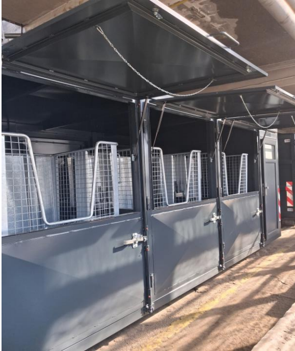
Časť s kójami na odpad