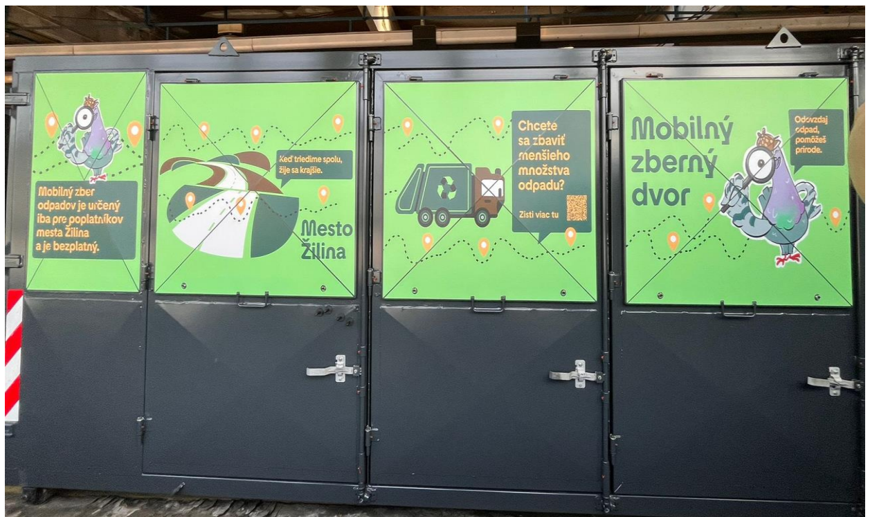
Mobilný zberný dvor

Mesto Žilina chce v tomto roku pilotne spustiť aj novú službu Mobilný zberný dvor . Táto služba je tak ako aj adresný kampaňový zber objemového a záhradného odpadu adresná, s obsluhou a je určená iba pre poplatníkov mesta, ktorí platia poplatok za komunálny odpad. Zavedením tejto služby budú mať občania zo vzdialenejších mestských častí možnosť odovzdať menšie množstvo rôzneho druhu odpadu.