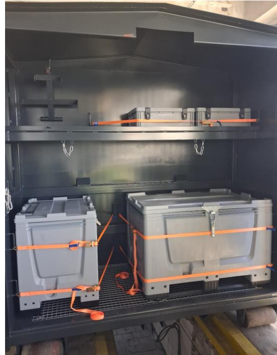
Časť na nebezpečný odpad

Občania budú môcť do kontajnera odovzdať napr. menší objemový odpad (rozobraté poličky a stoličky, sanitu), záhradný odpad (tráva, lístie), drobný stavebný odpad, textil, šatstvo, jedlé oleje, žiarivky, batérie, akumulátory, farby, malý elektroodpad - veľkosť a množstvo odpadu je limitované veľkosťou boxov. Druhy komodít, ktoré bude možné odovzdať do mobilného zberného dvora sa budú prispôbovať požiadavkám a potrebám občanov na jednotlivých lokalitách.