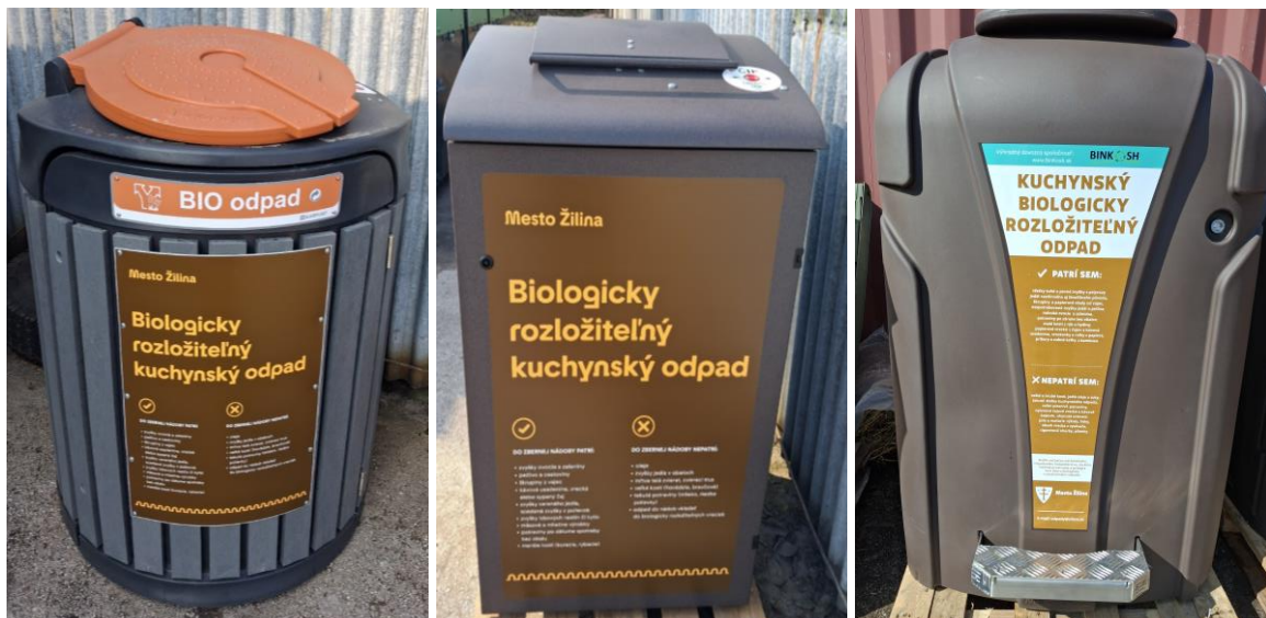
Nové typy krytov na biologicky rozložiteľný kuchynský odpad

Uzamknutie stojísk rieši viacero problémov: