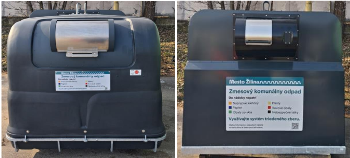
Nové typy nadzemných kontajnerov so spodným výsypom

v betónových krytoch a nový typ nadzemných kontajnerov so spodným výsypom s objemom 3 m 3 a 5 m 3 na zmesový komunálny odpad a jedno stojisko, kde je na zmesový komunálny odpad nový typ nadzemného kontajnera so spodným výsypom s objemom 3 m 3 . V testovaných stojiskách sú na všetkých kontajneroch na zmesový komunálny odpad osadené špeciálne bubnové nadstavby s objemom bubna 60 l. Okrem testovania nových typov kontajnerov sa budú testovať aj 3 typy krytov na biologicky rozložiteľný kuchynský odpad. Testované stojiská sú vybavené kamerovým systémom, ktorého cieľom je zabezpečiť účinný dohľad nad verejným priestorom pri maximálnom rešpektovaní súkromia obyvateľov a rýchlejšej reakcii mestskej polície.