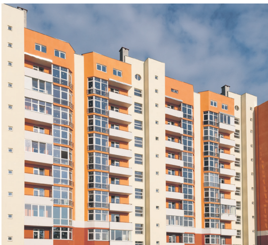
Mestskí poslanci odobrili aj vznik Developerskej spoločnosti mesta Žilina. Ilustračné foto.

Viac informácií a videozáznamy zo zasadnutí Mestského zastupiteľstva nájdete pod QR kódom: