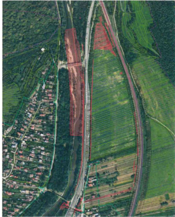
Mapka podľa GP č. 62/2023/2 kú. Brodno: