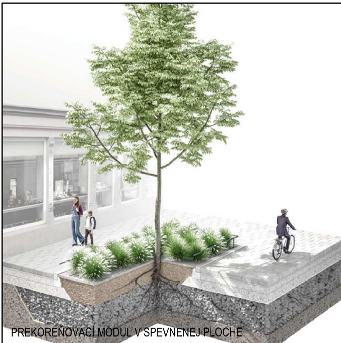
PREKONVENČNÝ MODUL V SPEVNENEJ PLOCHE