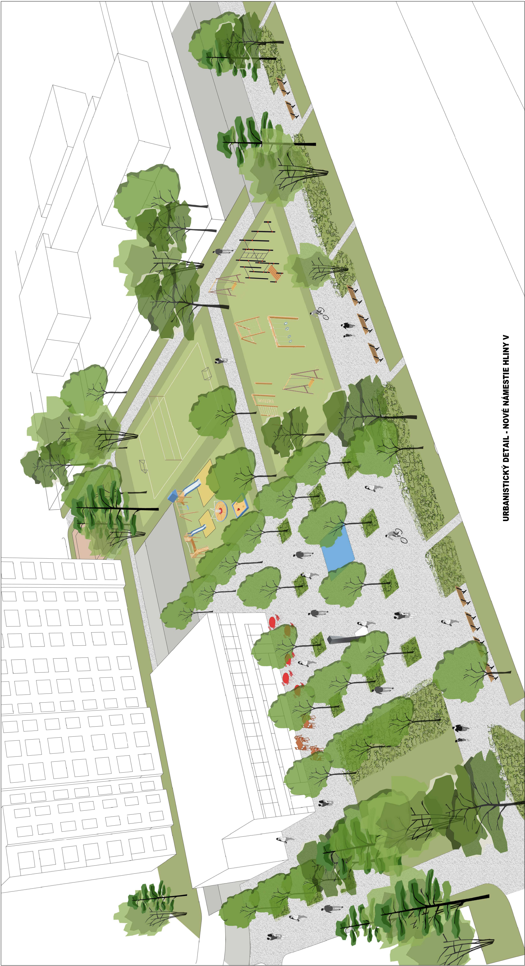
URBANISTICKÝ DETAIL - NOVÉ NÁMESTIE HLINY V