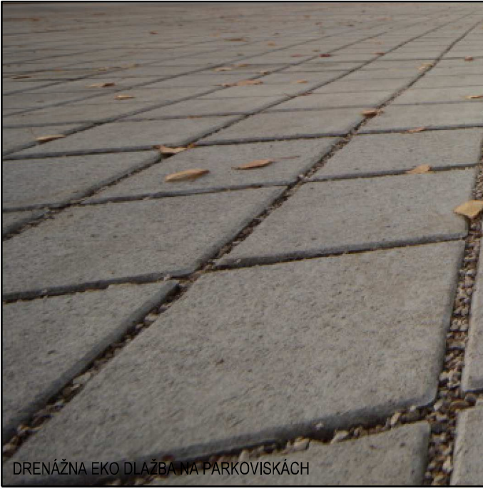
DREVENÁ PRÁCA NA POKROVOKÁCH