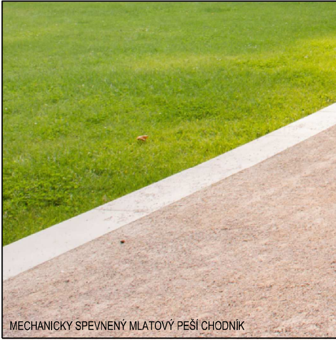
MECHANICKÝ SPEVNENÝ MLATOVÝ PEŠÍ CHODNÍK