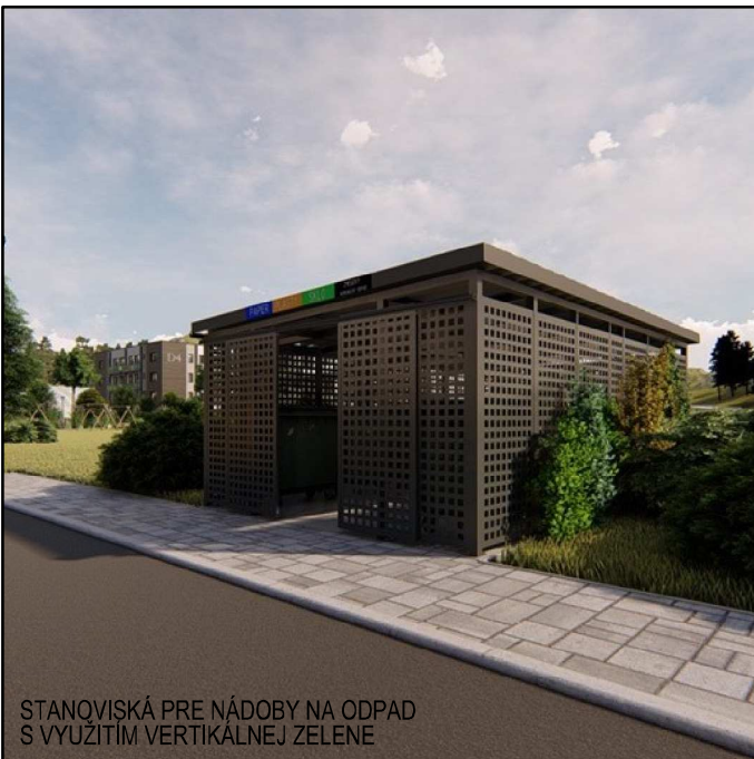
STANOVISKO PRE NADŠŤA NA ODPAD S VÝSTUPNÝM VETERNÝM ŽELEZOM