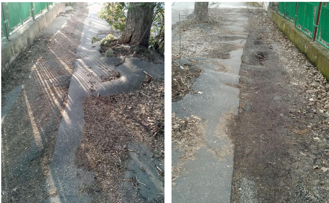
Obrázok 1 Súčasný stav chodníka na ul. M. R. Štefánika na niektorých miestach

Povrch chodníkov bude v 90% plochy z betónovej dlažby, zvyšok bude tvoriť žulová kocka.