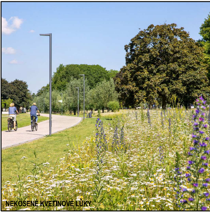
NEKOŠENÉ KVETINOVÉ LUKY