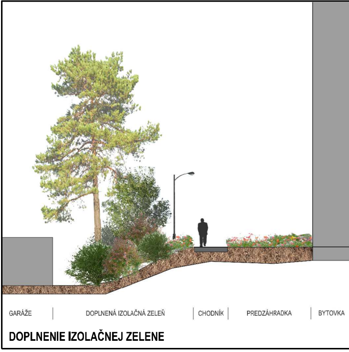
DOPLNENIE IZOLAČNEJ ZELENÉ