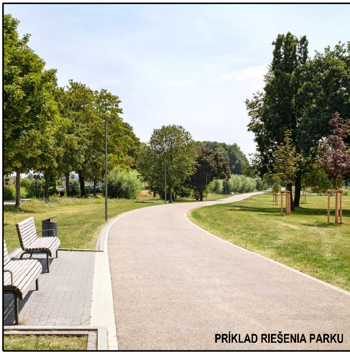
PRIKLAD RIEŠENIA PARKU