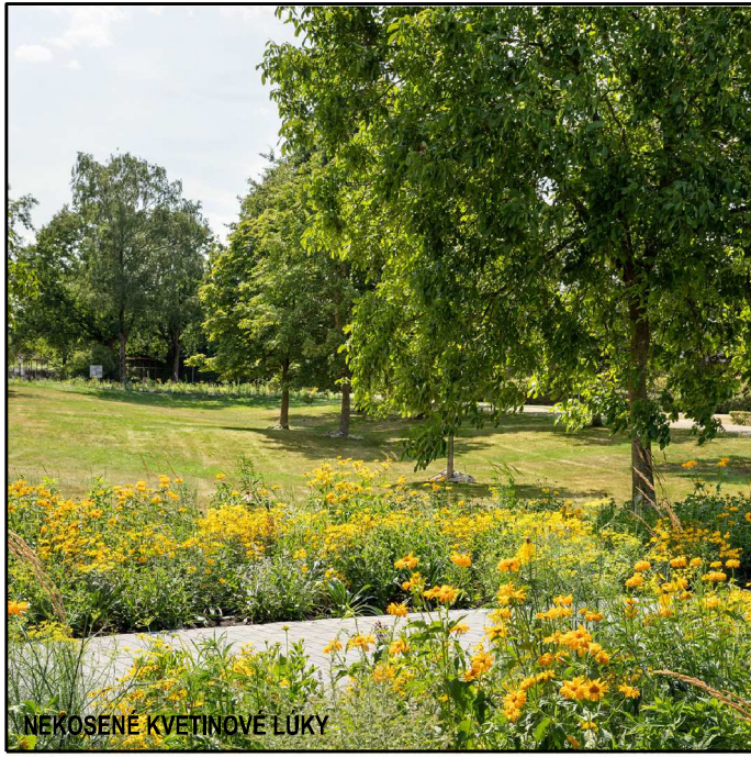
NEKOŠENÉ KVETINOVÉ LUKY