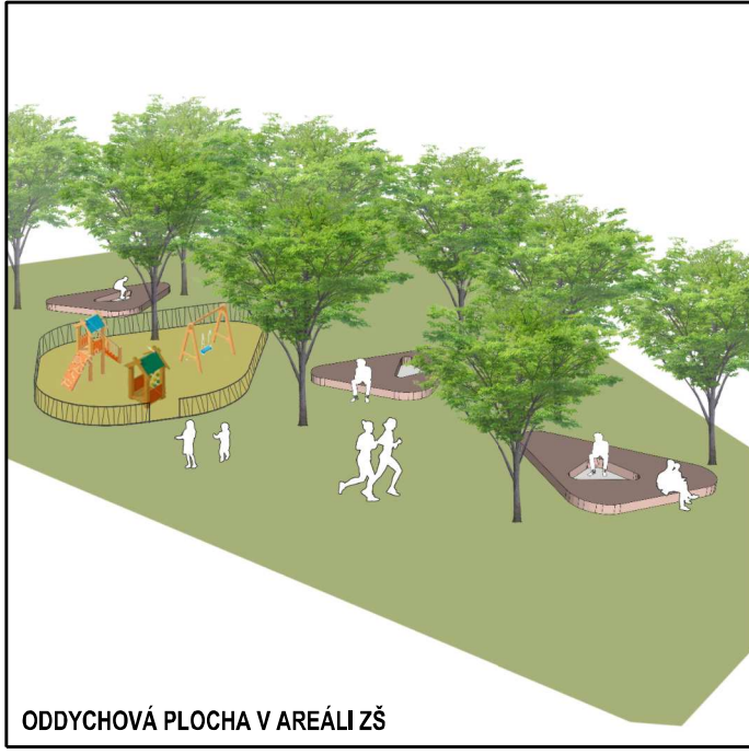
ODDYCHOVÁ PLOCHA V AREÁLI ZŠ