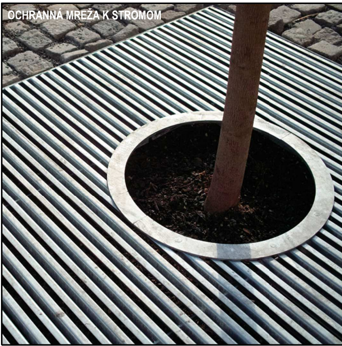
OCHRANNA VREZKA K STROMOM