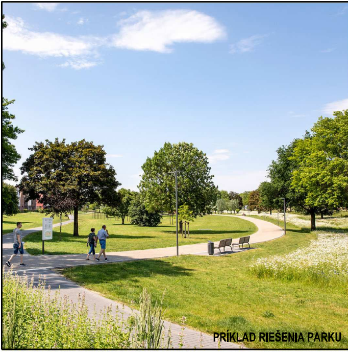
PRIKLAD RIEŠENIA PARKU