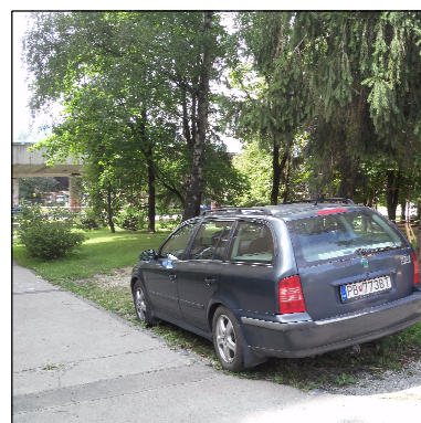
ZDEVASTOVANÉ PLOCHY VEREJNEJ ZELENÉ OBSLUŽNOU DOPRAVOU