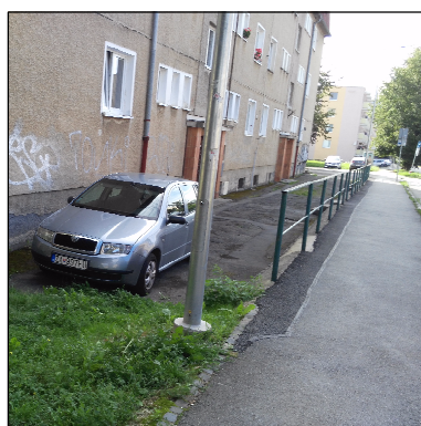
NEVHODNÉ FUNKČNÉ USPORIADANIE SPEVNENEJ PLOCHY