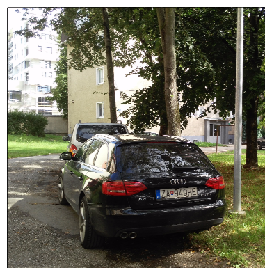
ZDEVASTOVANÉ PLOCHY VEREJNEJ ZELENÉ OBSLUŽNOU DOPRAVOU