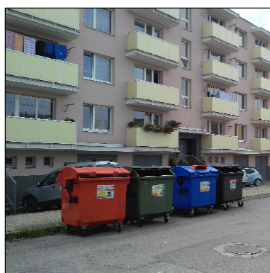
CHÝBAJÚCA KONCEPCIA RIEŠENIA UMIESTNENIA NÁDOB NA ZBER KOMUNÁLNEHO ODPADU