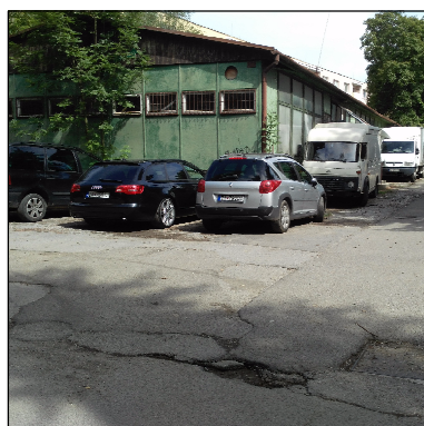
PROVIZÓRNA STAVBA NEVHODNE PÔSOBIACA V ÚZEMÍ