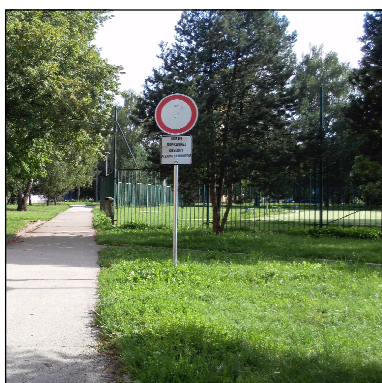
NEVHODNÉ USPORIADANIE LÍNIOVEJ KOMUNIKÁCIE S PREVLAĐAJÚCIM PEŠIM POHYBOM