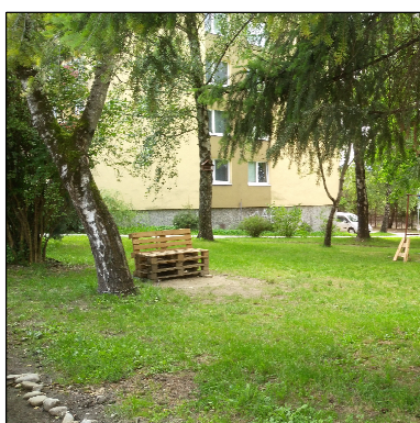
ABSENCIA RIEŠENIA DROBNEJ ARCHITEKTÚRY