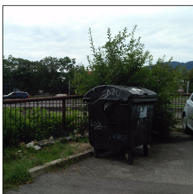
CHÝBAJÚCA KONCEPCIA RIEŠENIA UMIESTNENIA NÁDOB NA ZBER KOMUNÁLNEHO ODPADU