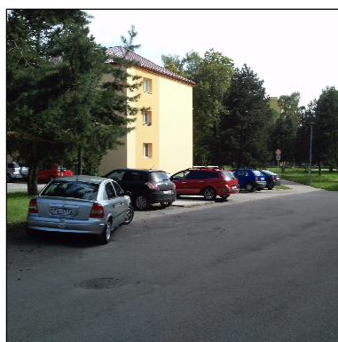
NEVHODNÉ FUNKČNÉ USPORIADANIE SPEVNENEJ PLOCHY