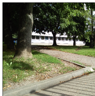
ZDEVASTOVANÉ PLOCHY VEREJNEJ ZELENÉ OBSLUŽNOU DOPRAVOU