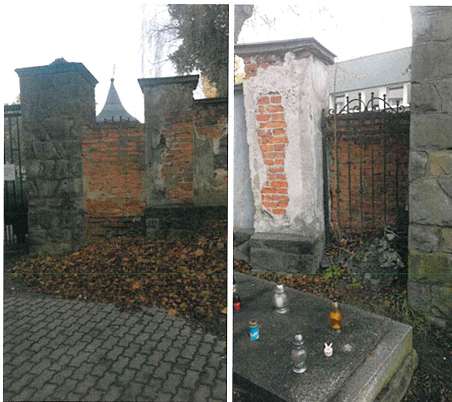
Fotodokumentácia súčasného stavu