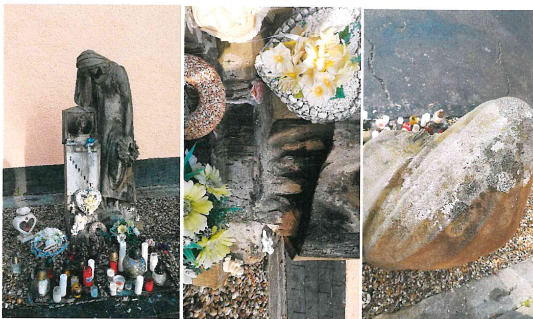
Fotodokumentácia súčasného stavu