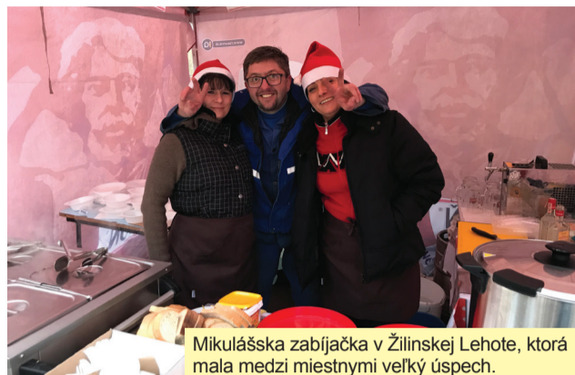
Mikulášska zabíjačka v Žilinskej Lehote, ktorá mala medzi miestnymi veľký úspech.

Ale nielen diviakmi žije naša sedmička. Po rokoch snaženia sa nám podarilo dosiahnuť lepšiu kvalitu komunikácie s občanmi – v Bánovej a Závodí sme inštalovali úplne nové mestské rozhlas. Stále prebieha úprava ich hlasitosti, preto budeme vďační za vaše podnety. Po-