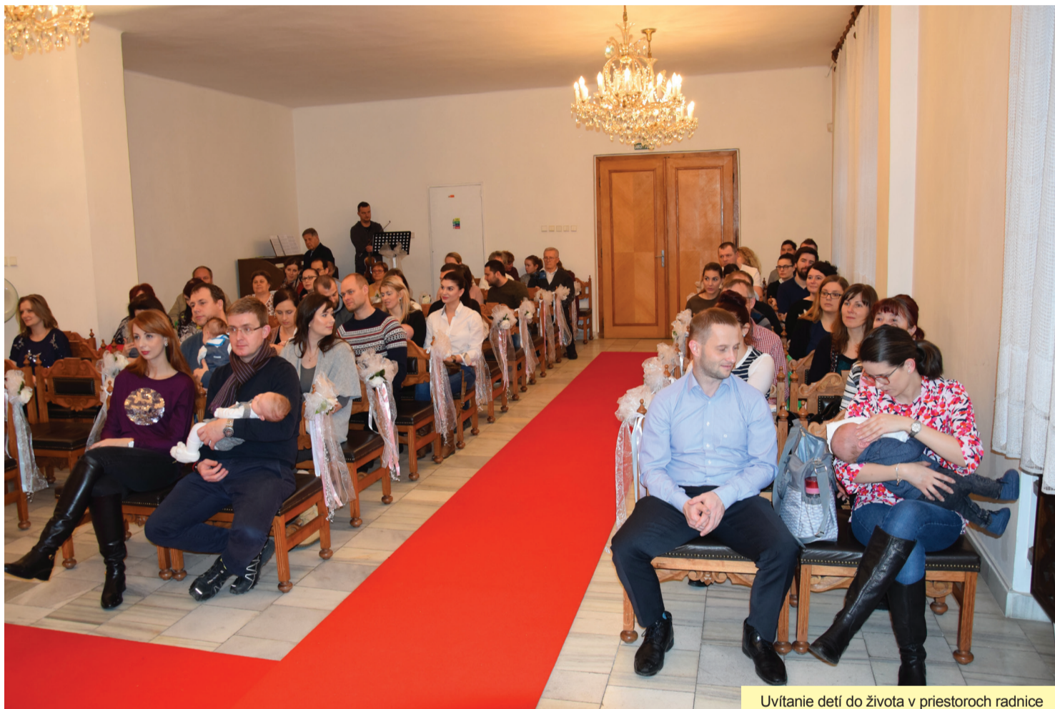
Uvítanie detí do života v priestoroch radnice

Matričný úrad v Žiline v roku 2017 evidoval 1 547 novorodencov. Oproti minulému roku to prinieslo nárast o 137 detí. Naposledy sa toľko detí narodilo v roku 2012. Chlapci majú menšiu prevahu, narodilo sa ich o 23 viac ako dievčat.