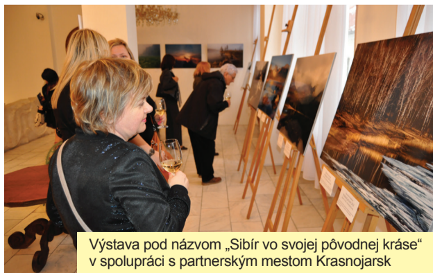
Výstava pod názvom „Sibir vo svojej pôvodnej kráse“ v spolupráci s partnerským mestom Krasnojarsk