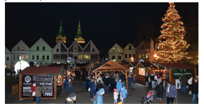
Oproti minulému roku sa podarilo vyzbierať o 103,86 eura viac.