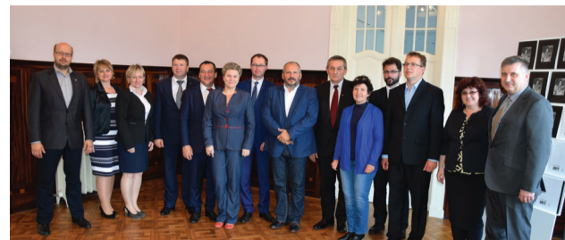
Prijatie zástupcov partnerských miest počas Staromestských slávností 2017 v Rosenfeldovom paláci