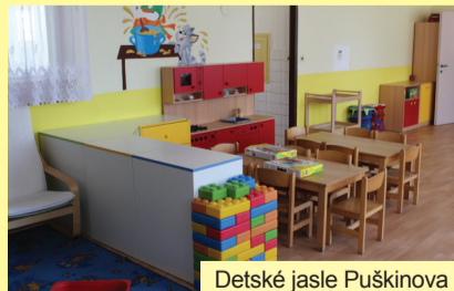
Detské jasle Puškinova