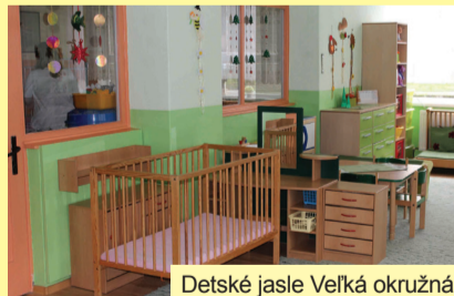
Detské jasle Veľká okružná

Bližšie informácie poskytnú pracovníci odboru sociálneho a bytového na tel. č.: 041/70 63 407, 041/70 63 503 (Klientske centrum). Do detských jaslí môže byť prijaté dieťa od dovŕšenia 1. roka do 3 rokov veku.