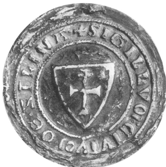
Pečať mesta Žilina